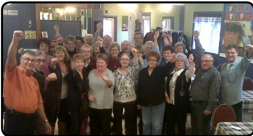
Rencontre avec des bénévoles des Centres d'action bénévole des secteurs Shawinigan et Grand-Mère.

Le Centre d'action bénévole de Shawinigan entre en contact, depuis plusieurs semaines, avec les 4000 personnes qui ont démontré un intérêt à devenir bénévole dès la mise en candidature. Encore une fois, un grand merci!